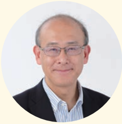
年賀寄付金評価委員会 委員長